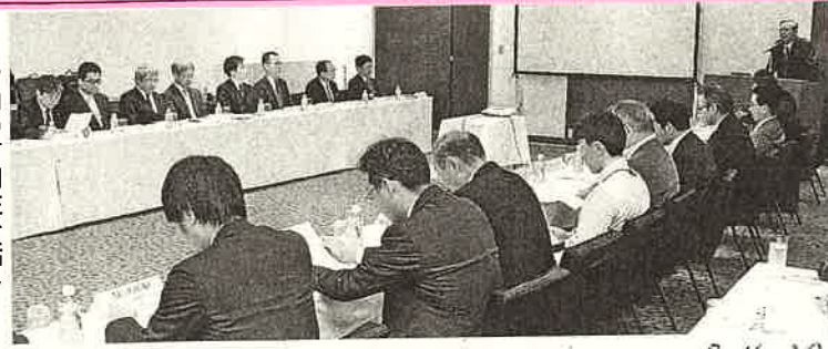
活動の方向性を話し合った設立総会

造船や支援へ 山口F 山口フィナ IP(FG、 日、造船・海 産業の支援 「モヒリテ にも新設す