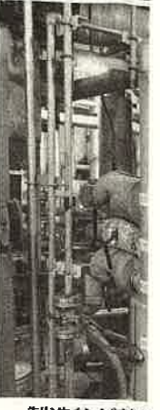
製造が熱 釜まで上 近しく 働ける製造現場の環境を整える。