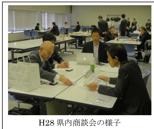
H28 県内商談会の様子

※その他県内に拠点を置く食品総合卸売業 3 社（三井食品㈱、中村角㈱、伊藤忠食品㈱）も招聘。