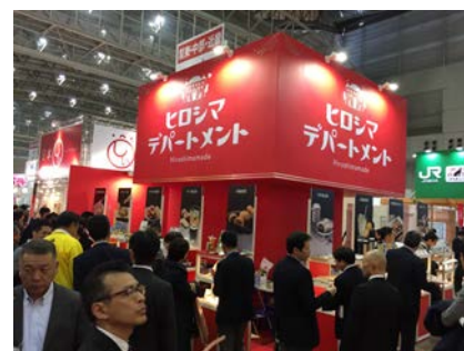
スーパーマーケット・トレードショー 2017 の様子