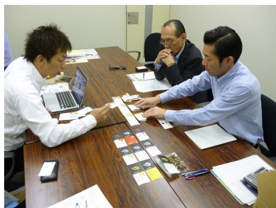
ブラッシュアップの様子