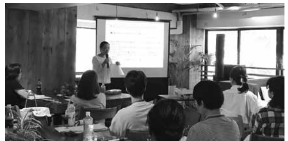
前回セミナーの様子