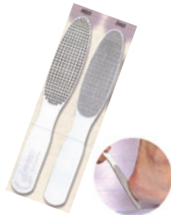
フットケア用ダイヤモンド かかとヤスリ(シルキーヒール)