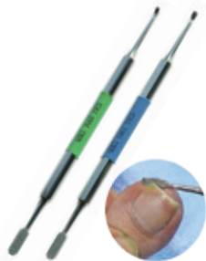
フットケア用ダイヤモンド 爪ヤスリ(角用)