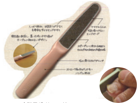
介護用ダイヤモンド 爪ヤスリ(ネルファ・ダブル)

早く、キレイに楽々爪ケア！ 人間工学に基づいた持ちやすいグリップ！ 安心で安全なフォルムとやわらかなカラー！