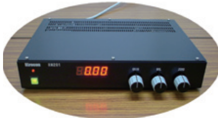
表面反応測定装置（さび安定度測定装置）

小規模回路から FPGA や DSP を応用した大規模システムまでご要望にあわせたハードウェア開発を行います。特殊なボード設計や組み込みソフトウェアも含めたトータルシステムとして提案・開発いたします。