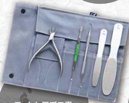
フットケアプロ用 スターセット [1・2]