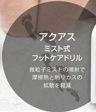
アクアス ミスト式 フットケアドリル