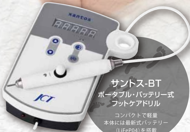
サントス-BT ポータブル・バッテリー式 フットケアドリル