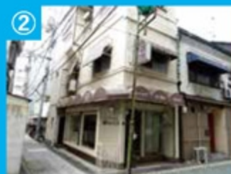
② グリーンロード沿いの旧店舗