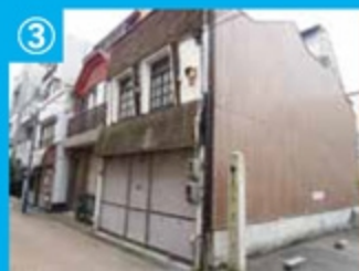
③ 御作事通り沿いの旧店舗