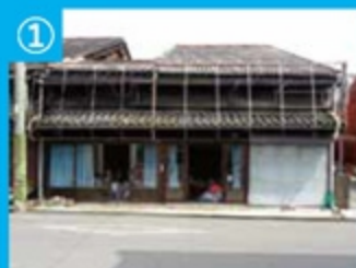
① 本町通り沿いの古民家