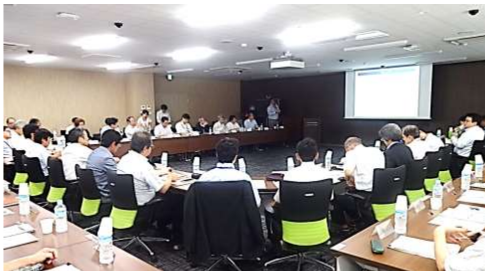
代表者会議の様子 6 常任団体、地場企業の代表者が参加し、活発な議論がかわされました。

商品の機能や性能、あるいは顧客や商品を取り巻く環境などを数理モデルで表現し、計算機によるシミュレーションを徹底的に行うことで、技術のブレークスルーを達成し新しい商品価値を生み出す技術。