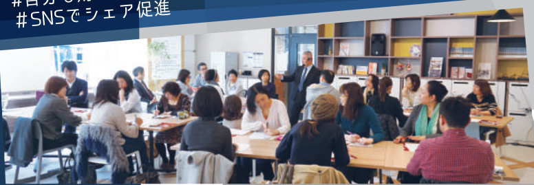
※昨年度 広島市開催時の様子