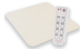
シートセンサー 「ふむくる」