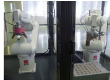
ロボット導入の検証場も用意しております