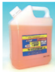
溶接焼け取り用中性塩電解液