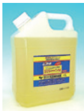
電解研磨用電解液