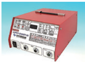
ステンレス製品電解用電源器