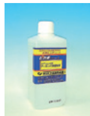
マーキング用電解液