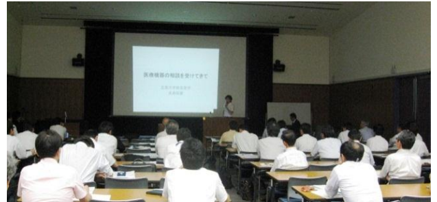
「医療機器の相談を受けてきて」 広島大学 医歯薬保健学研究科 救急医学 貞森助教