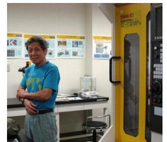
超精密ナノ加工機・小型マシニングセンター