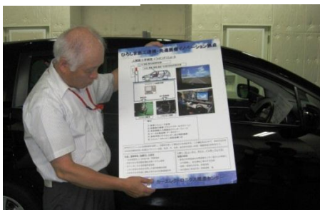
実車シミュレーター