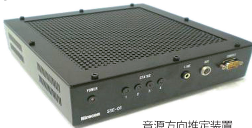
音源方向推定装置