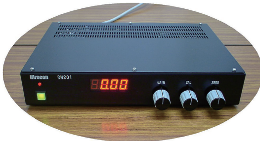
表面反応測定装置(さび安定度測定装置)